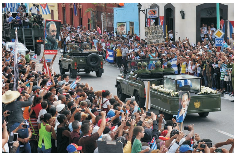
La caravana en el centro histórico de la ciudad.

El tributo tuvo como escenario el centro de convenciones Lázaro Peña, de la Central de Trabajadores de Cuba en este territorio, el lugar elegido para la parada y donde el oficial relata detalles del luctuoso homenaje y exclama: “Esta fue la tarea, la misión más importante que he asumido en mis 36 años de servicios hasta ese momento en las Fuerzas Armadas Revolucionarias y que nunca hubiera querido cumplir”.