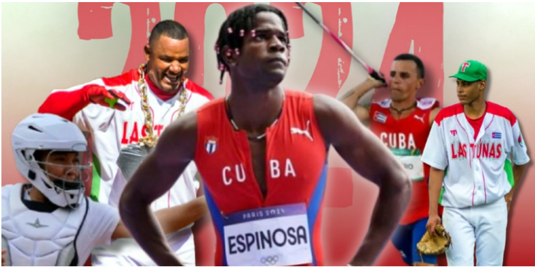
Infografía: Del autor