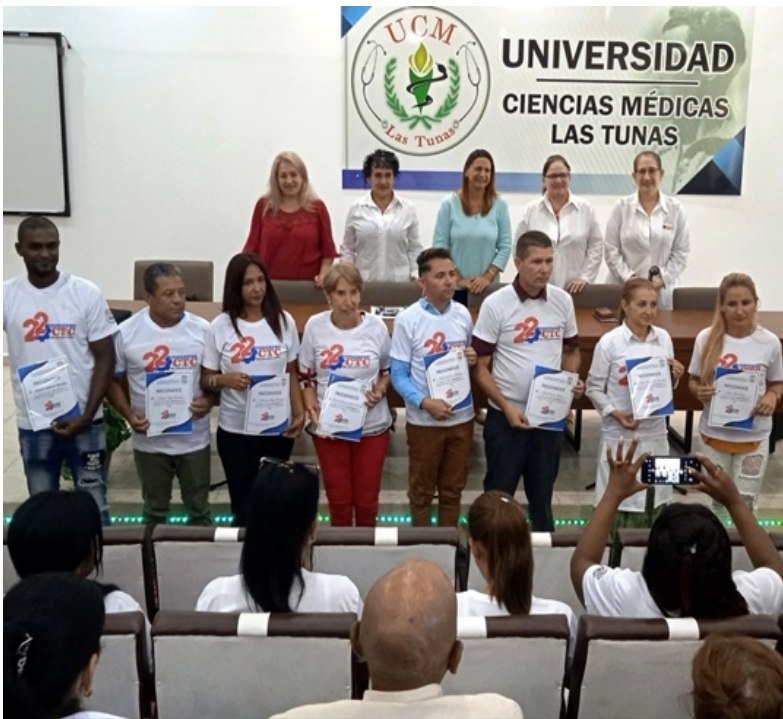
Los delegados del sector de la Salud.

De esa manera se va conformando la delegación tunera a la trascendental cita del movimiento sindical y del pueblo cubanos, porque en ese evento se definirán estrategias para continuar creando en beneficio del desarrollo económico y social de la nación.