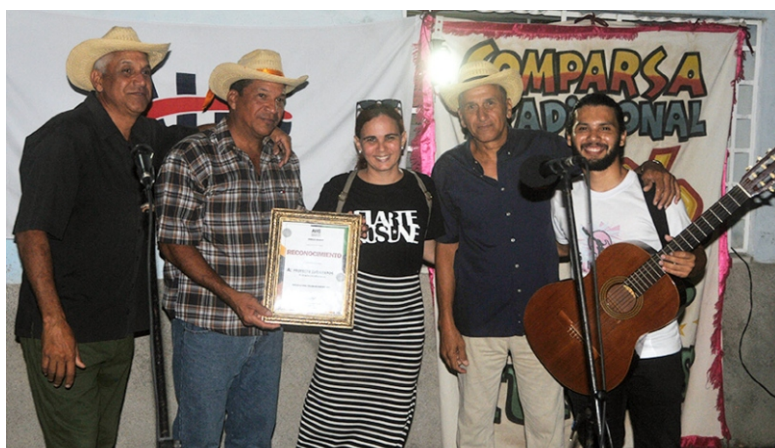
El Festival comenzó con el ritmo del proyecto comunitario Zabaleando.