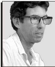
Por István Ojeda Bello