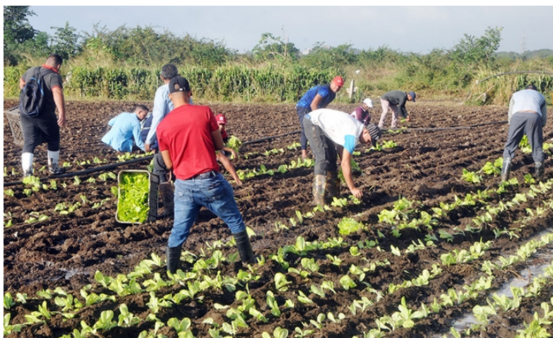
Por Dayana Menzoney Justiz

A PARTIR de la convocatoria hecha por la dirección del país y el Buró Provincial del Partido, desde el movimiento político Tarea de Grandes y en saludo al Triunfo de la Revolución, se han convocado varias jornadas de trabajo voluntario, en diferentes sectores, dirigidas a la producción de alimentos y la transformación de las comunidades.