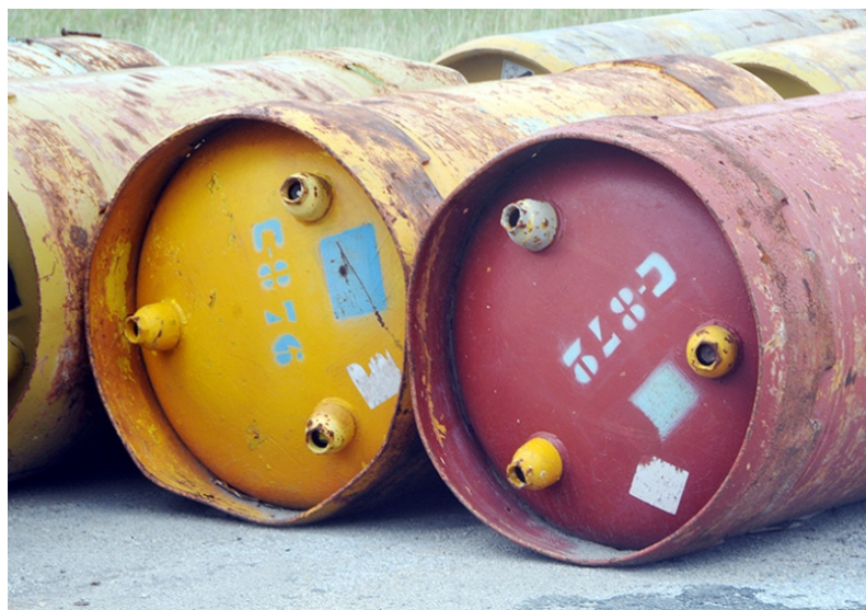
Los recursos para el tratamiento del agua están en la planta.