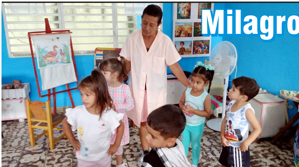
Texto y fotos: Yenima Díaz Velázquez

A la altura del 2024, ese puente está en ruinas, de nuevo; mas, la crudeza del ambiente actual entre ambos países no puede llevarnos a olvidar las repercusiones que en el imaginario común tuvo el 17D. Las corrosivas expresiones de los odiadores de turno no pueden conducirnos a desterrar de nuestras mentes la posibilidad del diálogo respetuoso.