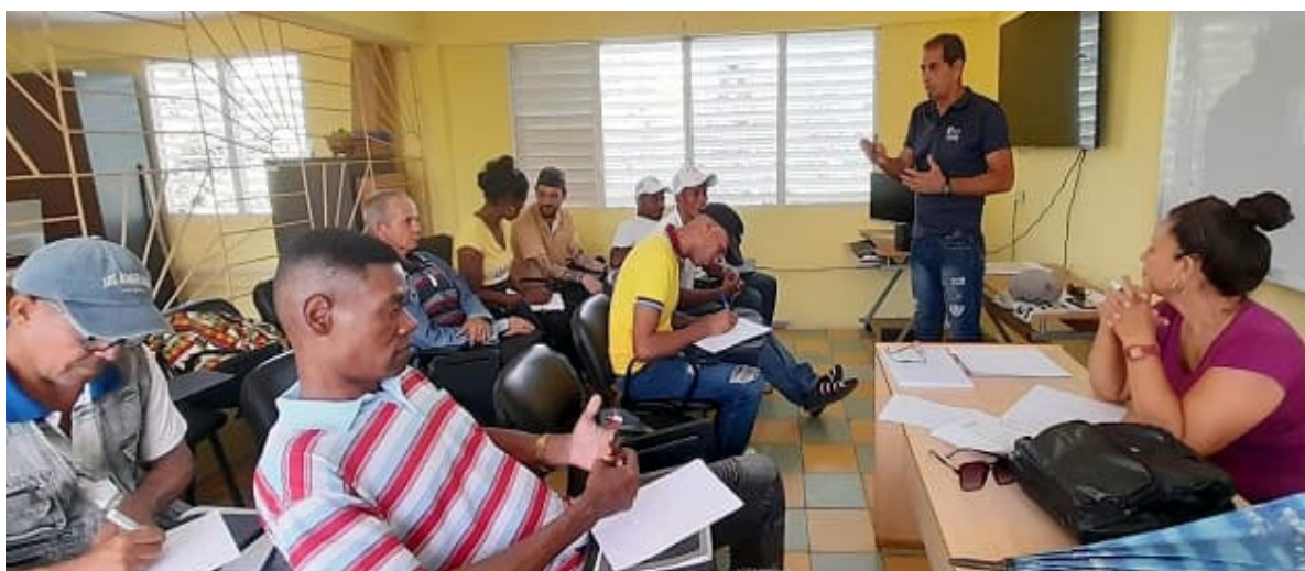
Texto y foto: Bárbara Sánchez Ramírez

Al ser una de las mejores vías para mitigar los efectos del cambio climático, se desarrolló en Jobabo un taller de capacidades sobre el manejo del ecosistema marino, como parte de la implementación del Proyecto Internacional Mi Costa.