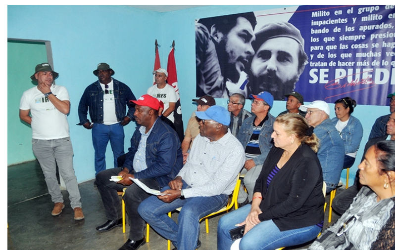
Las potencialidades de Las Tunas para lograr más con el proyecto IRES quedaron evidenciadas en el encuentro.