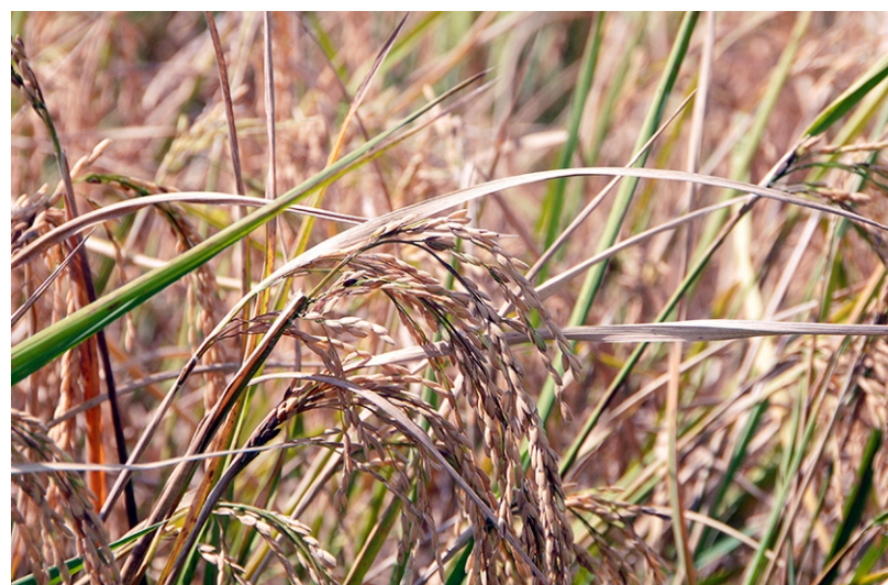
La calidad del grano de arroz cosechado en “Amancio” y su precio llamaron la atención del dirigente cubano.

“Es ese el problema más grande que ahora existe en el país; y tene-