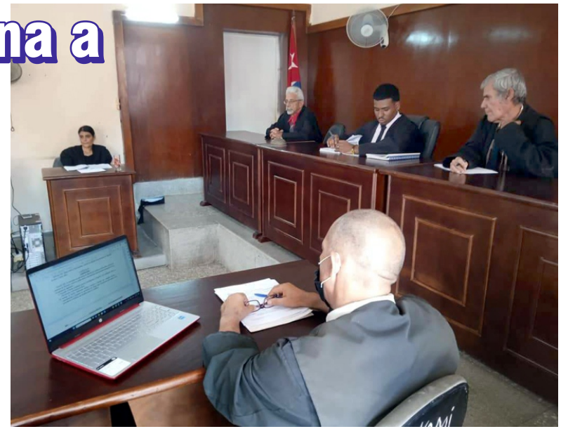
Al sancionado y a la Fiscalía les asiste el derecho de interponer recurso de casación contra la decisión del órgano judicial.

Como sanciones accesorias, se le aplicó la privación de los derechos públicos, regulado en el Artículo 42.1 de la Ley 151 del 2022 Código Penal, y la prohibición de solicitud de pasaporte y salida del territorio nacional durante el cumplimiento de su condena, estipulado en el Artículo 59 del propio texto legal. Además, debe indemnizar, por concepto de pensión alimentaria, a cada menor de edad hasta que arriben a la mayoría de edad o culminen los estudios.