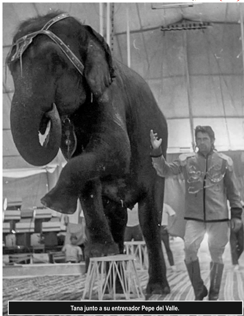
Tana junto a su entrenador Pepe del Valle.

mó; intentaba pararse, pero no podía. Enseguida se desalojó la pista y se fue apartando el escenario para ayudarla, pero en vano. Toda la noche estuvieron en vela el personal del circo, los agentes encargados de la seguridad del espectáculo y los veterinarios, intentando curarla. Afuera, en el pueblo no se hablaba de otra cosa y los muchachos iban hasta la carpa a curiosear.