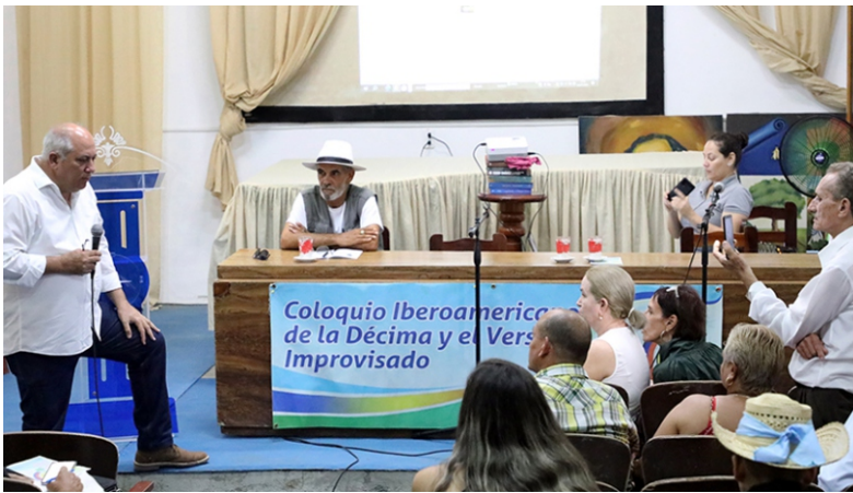
El ministro de Cultura compartió sus apreciaciones sobre la Cucalambeana en el Coloquio de la Décima.