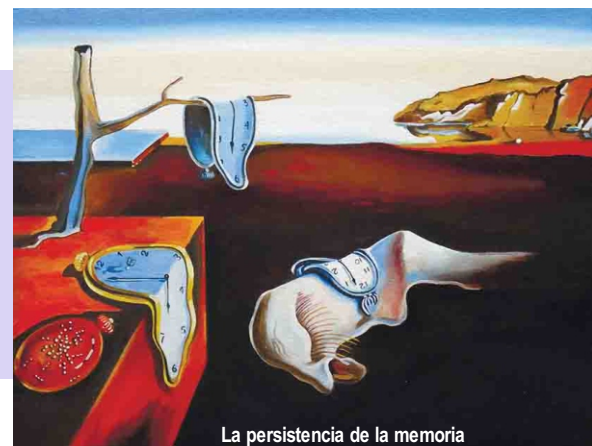
La persistencia de la memoria

Partió a la eternidad en 1989, dejándonos una obra valiosa. Ese místico narcisista, exhibicionista y estafalario ser inyectó de energía al surrealismo europeo y fue su más digno representante. Él, que desde adolescente mostró dotes artísticas, aún nos persigue. Y es que, como dijo una vez: "Cuando se es un genio no tenemos derecho a morirnos, porque hacemos falta para el progreso de la humanidad". Señor bigotes, cuánta razón tenía. (Y.M.H.)