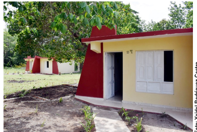
El remozamiento del motel 30 de Diciembre era un viejo anhelo en Jobabo.