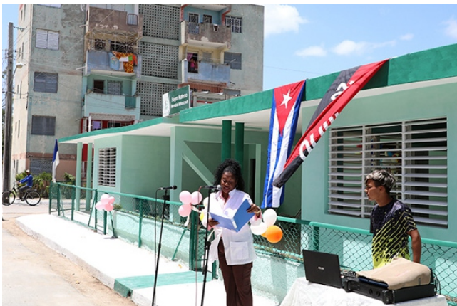
El hogar materno Herminia Betancourt viene a reforzar la atención a las gestantes.