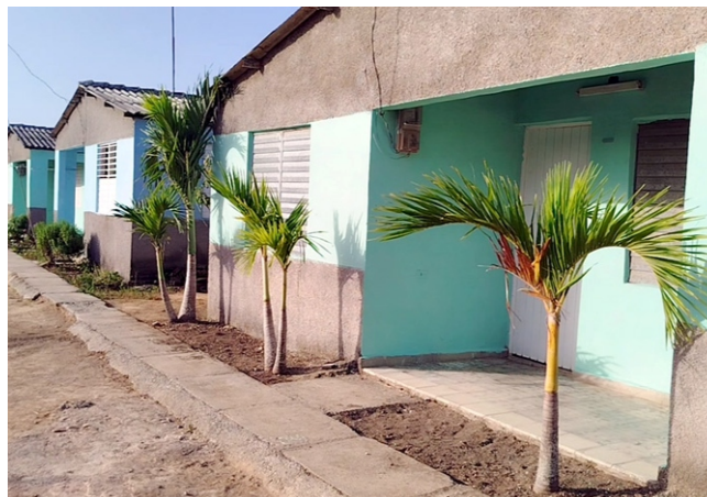
Viviendas en Manatí lucen nuevo rostro.