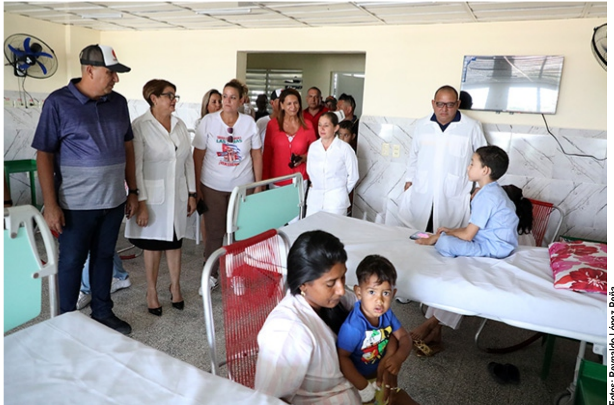
La nueva sala del pediátrico Mártires de Las Tunas marca una diferencia en la gestión médica institucional.

Ese logro se debe a la mipyme Construcciones Tristá, que acometió las faenas y donó, además, los 450 mil pesos que costó la inversión.