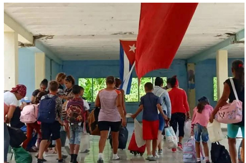
Los centros de evacuación se alistaron con rapidez y fueron refugio seguro para muchas familias de todo el territorio.