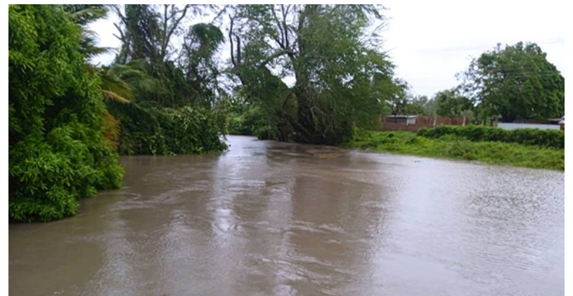
El desbordamiento de la represa local generó gran tensión en el poblado de Delicias.

Desde Manatí se reportan perjuicios en cubiertas ligeras de viviendas. En Puerto Padre hubo daños en domicilios y el tendido eléctrico y telefónico. La situación más severa acaeció en la comunidad de Delicias por el desbordamiento de la represa ubicada en esa localidad, que provocó inundaciones en viviendas de los barrios La Represa y La Granjita, específicamente en las calles 29, 41 y 45.