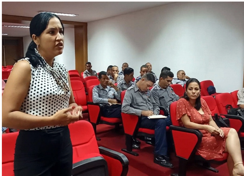
Texto y foto: Dayana Menzoney Justiz

LA ACTIVIDAD del juez de ejecución ha demostrado su utilidad y necesidad como herramienta indispensable en la aplicación de la política de prevención y enfrentamiento a hechos delictivos y antisociales.