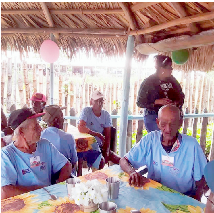
Texto y fotos: Giosber Pérez Tamayo

Los adultos mayores y las personas en situación de vulnerabilidad continúan siendo prioridad para el Estado cubano. Por ello, en el municipio de Amancio se inauguraron dos hogares de atención comunitaria, ubicados en las circunscripciones 39 y 8, en los barrios El Uno y Las Delicias, respectivamente.