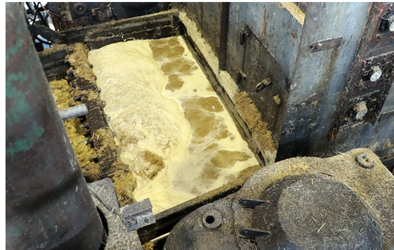
Urge que la zafra empine su rumbo.

En el sector de la Salud, reseñó los esfuerzos para recuperar el deteriorado parque de ambulancias. “Hay días de trabajar con dos o tres ambulancias en la provincia”, admitió, detallando que se buscan soluciones con talleres estatales y no estatales para su reparación.