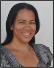
Por Lledys Masó Peña

Si la logística complejiza los espectáculos pomposos, "explotemos" más acciones culturales en escuelas y centros de trabajo. Alentar visitas a galerías, talleres de creación o apreciación, conferencias e invitaciones semejantes no ameritan de grandes aseguramientos. Pensemos qué más podemos hacer. Estimulemos expresiones jugosas y no siempre tan visibles como la artesanía, la culinaria, los juegos típicos, la Medicina Natural y Tradicional... La comunidad es el alma de los pueblos; no solo se trata de recreación, también es nuestra herencia e identidad.