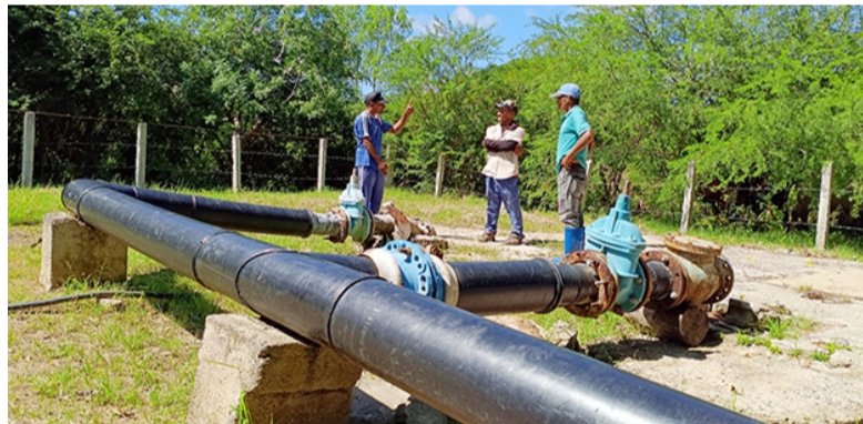
Jobabo es el municipio que en el período menos respuestas ha dado a la población; algunas de las inquietudes están relacionadas con la conductora de agua de Birama.

"Es necesario buscar qué nos falta en cada lugar. Hay que crear los espacios para vincularse con el pueblo, y que la gente diga lo que siente. Hagamos una revolución en cada municipio. Asumamos lo que nos corresponde; lo más importante es que lleguemos a la comunidad".