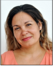
Por Yelaine Martínez Herrera