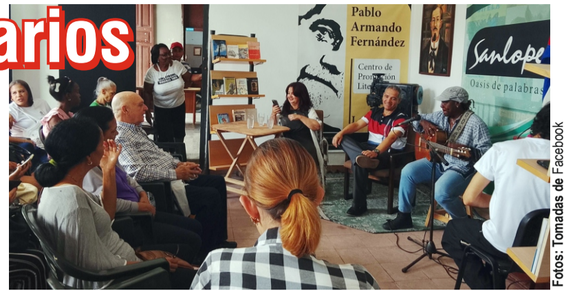
La Sanlope vive nuevos aires de sede cultural.