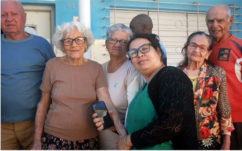
Texto y fotos: Leane Escalona Ojeda

EN EL corazón del reparto Buena Vista, en la provincia de Las Tunas, existe un espacio donde los adultos mayores sonríen. Un sitio donde las arrugas no son surcos de tristeza. Es la casa de abuelos Guillermo Tejas, un hogar que late al ritmo de la alegría y la compañía.