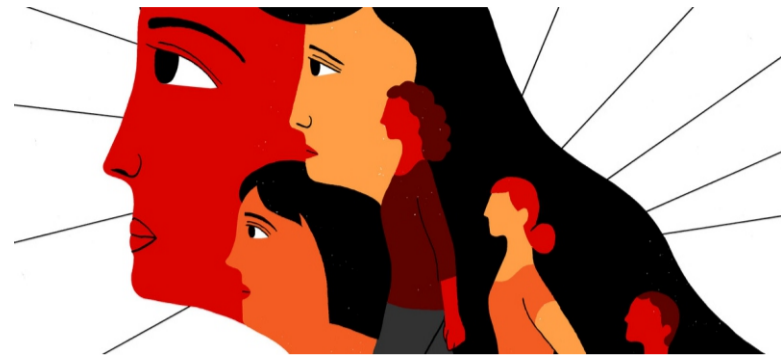
Ilustración: ONU Mujeres

Visibilizar la violencia y su manifestación más cruenta sigue constituyendo un reto inmenso. Cada vez que me atrevo a escri-