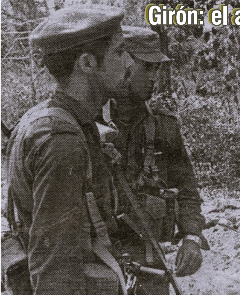
El comandante Efigenio Ameijeiras (en primer plano) en Girón.