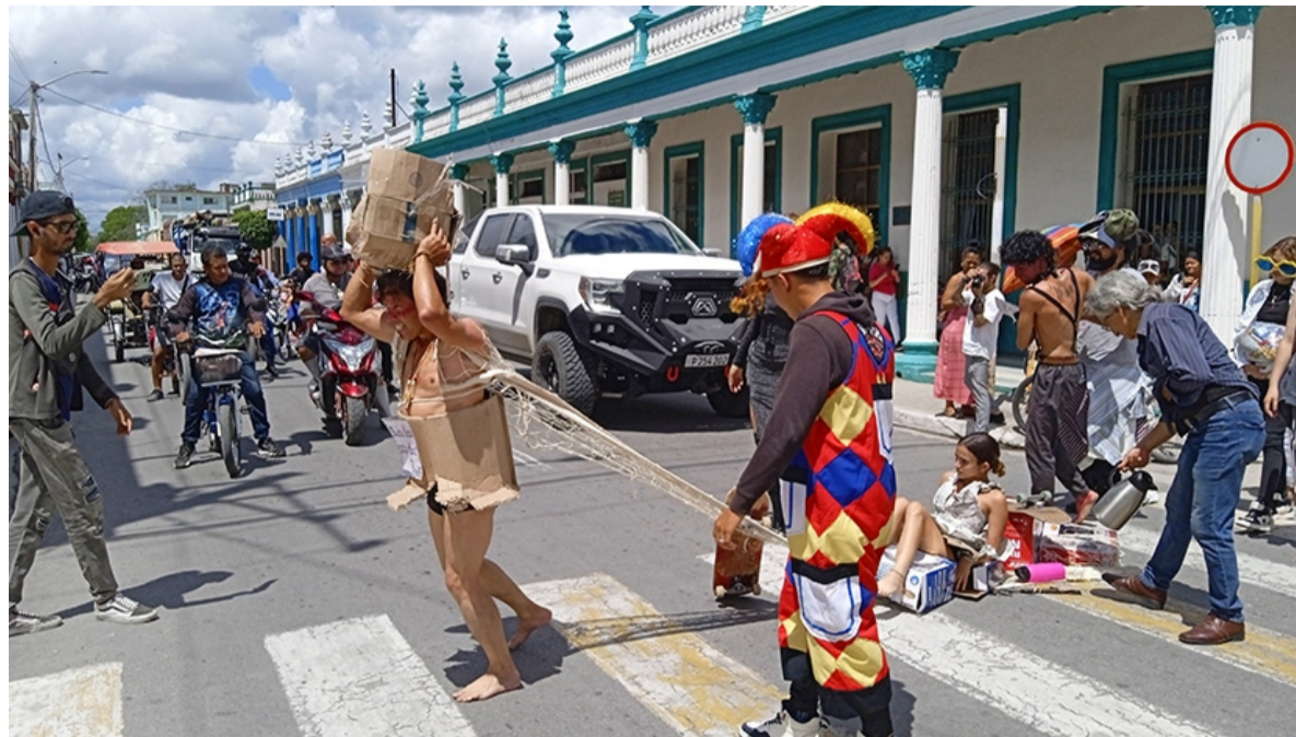
El performance El cosificador literalmente paró el tránsito y dio la posibilidad de interactuar con la obra.

Sin embargo, toda obra humana es perfecta. Desde 26 seguimos notando que el apoyo de otras instituciones a esta Jornada continúa siendo insuficiente. Y la cultura no debe verse como un grupo de entidades aisladas, sino como un entramado donde todos sus componentes se sumen y aporten, espiritual y materialmente, en la medida de lo posible. A veces, con solo estar presentes en acciones del programa, se vislumbra el deseo de apoyar y acompañar. Hechos tan simples como contribuir con algún diploma o manualidad para agasajar a un autor con premio colateral resulta motivador. Esto es algo que debiera interesar siempre no solo a las autoridades