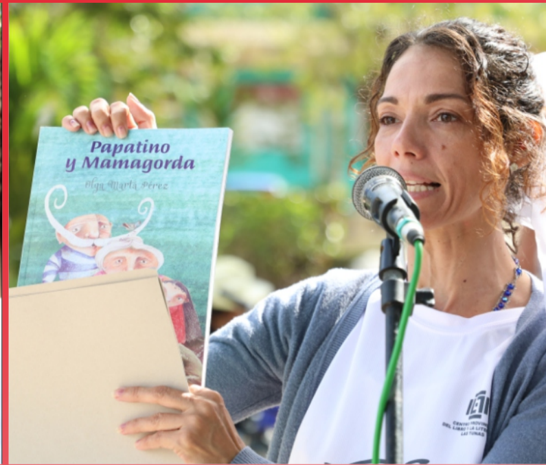
Diseño y fotos: Reynaldo López Peña