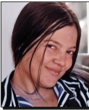
Por Claudia Ligget Amado Barceló

Por más que la provincia esté siendo favorecida por dos proyectos nacionales que pretenden accionar en contra de la violencia de género aquí, sigue faltando un protocolo de actuación más efectivo, sobre todo, centrado en la prevención. ¿Hasta cuándo vamos a continuar lamentando la muerte de otra mujer? ¿Y seguirá expresándose por lo bajo?