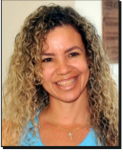
Por Yuset Puig Pupo