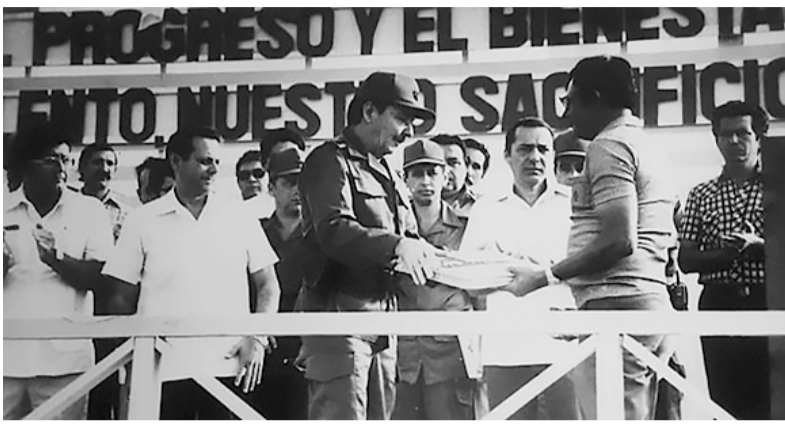
Por Osvaldo Morfa Lima (Investigador)

H ABLAR de 1986 en la provincia de Las Tunas es evocar el olor a caña recién molida mezclado con el polvo de la construcción. Era el tiempo de los cumplimientos al pie de la letra, de las reuniones de chequeo con sabor a compromiso y de una certeza colectiva: el central Majibacoa no sería solo otro ingenio, sino un monumento viviente a los caídos en Girón.