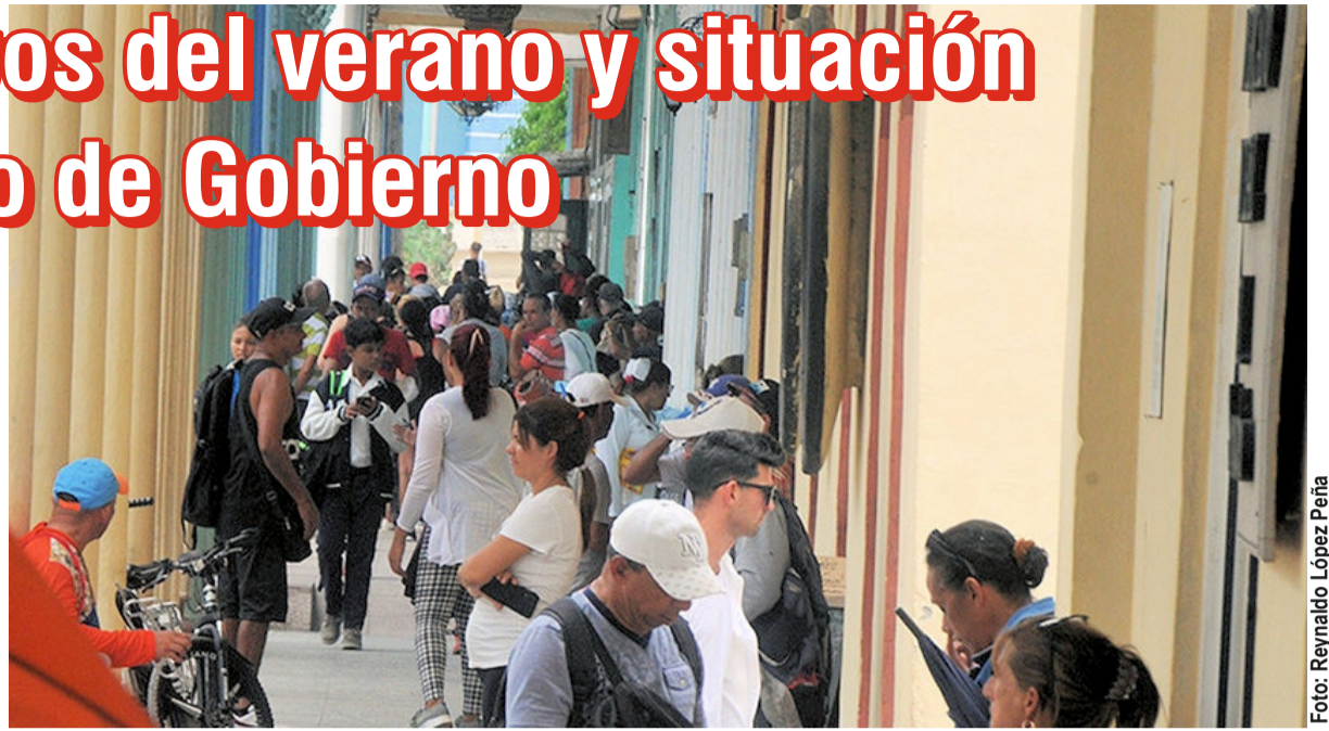
Mientras hay sectores claves con altos números de vacantes, una cifra nada despreciable de tuneros no acepta las ofertas de empleo realizadas.

Uno de los datos más llamativos es el incremento de 70 emba-