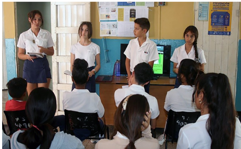
El proyecto Prevención de Ceguera por Glaucoma, respaldado por el centro, llega con divulgación científica a las escuelas tuneras.

Tras seis meses de trabajo, lograron recuperar el salón de procedimientos quirúrgicos con el respaldo de las autoridades hospitalarias. Este espacio beneficia las intervenciones por tumores, afecciones de oculoplastia, glaucoma, catarata y de retina, cuatro subespecialidades que hoy concentran el mayor volumen de cirugías en Las Tunas.